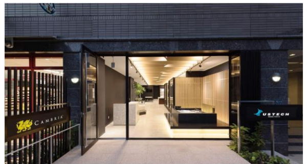
アステック東京ショールーム@南麻布

〒106-0047 東京都港区南麻布2-11-10 Tel：03-6435-4726 月～土 10:00-18:00 日祭定休