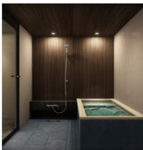
QL壁面パターン2 縦置