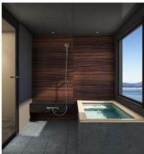
WABURO QL LINE 1620 QL パターン1 縦置