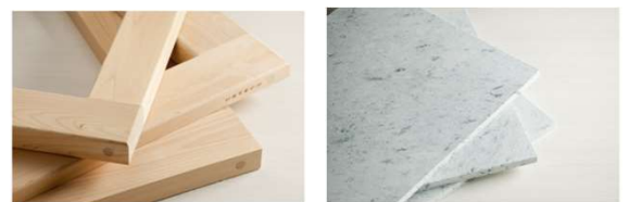
薫り高い天然素材 厳選檜 紺碧アジュール 厳選十和田石