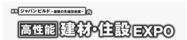
WABURO QL SUI 粹