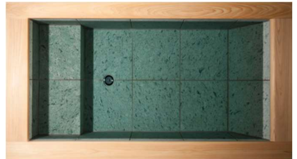
USTECH製 和モダン WABURO 十和田石浴槽

厳しい防水基準を満たしながら、樹脂製浴槽とは全く異なる圧倒的質感を達成。「和 WABURO」シリーズは、長年、旅館・ホテルの業務用浴槽で培ったアステックの技術力を結集、浴槽内部・框（かまち）共に厳しい防水基準を満たしながら、樹脂製浴槽とは全く異なる圧倒的質感をもつ天然石（厳選の御影石・内装には希少天然石でマイナスイオン発生、鮮やかな紺碧AZUR（アジュールブルー）の魅惑の「十和田石」）を贅沢に標準採用したアステックデザイン浴槽ERNを採用。浴槽の顔となる框（かまち）には心地よい芳香とフィトンチッドを放つ自然素材「檜」を採用、五感にも響く仕様で心も身体もリラクゼーションの彼方へと誘います。