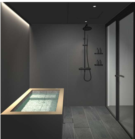
Model : WABURO QL MIYABI 1616 税抜 235万円 (税込258.5万円) WABURO QL MIYABI 1620 税抜 250万円 (税込275万円)